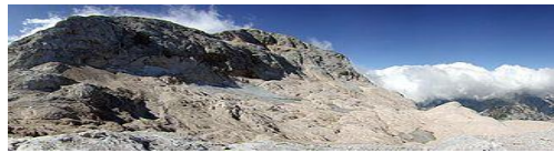
Ledenik pod Triglavom leta 1905 in leta 2002

Društvo DVIg univerza za tretje življenjsko obdobje je uvrstilo v svoj program sklop predavanj in pogovorov o podnebnih spremembah. Namen študijskega krožka ni povzemanje znanstvenih raziskav, političnih odločitev državnih institucij, temveč razširitev lastnega dojetja sprememb podnebja, ki smo jim priče v vsakdanjem življenju. Želimo si razjasniti le določene dileme, ki se nam, ob vseh neskončnih poročilih raziskav, leporečjih politikov in državnih usmeritvah ter svetovno sprejetih zakonih, porajajo.