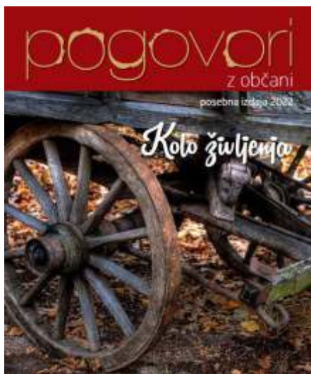
KOLO ŽIVLJENJA posebna izdaja Pogovorov