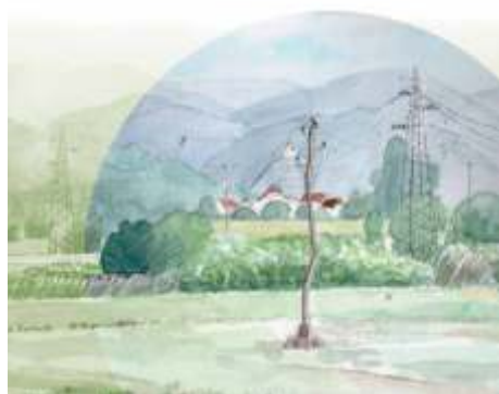
Naslovnica 7 številke POGOVORI Z OBČANI