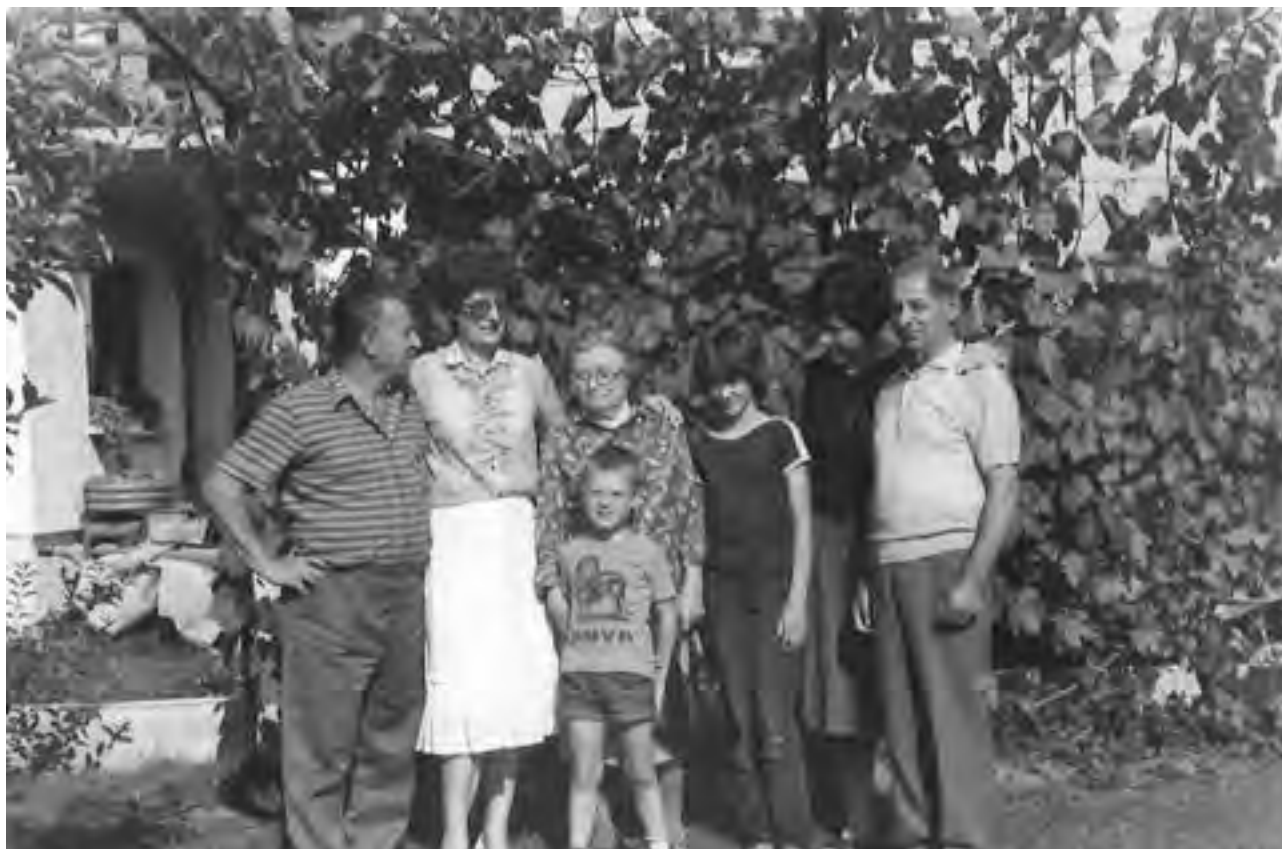
Ninina družina in Franci z ženo

Povsod so me porabili in sem tako hodil okoli, pa sem si rekel, terena je dovolj in naj se drugi tam matrajo.