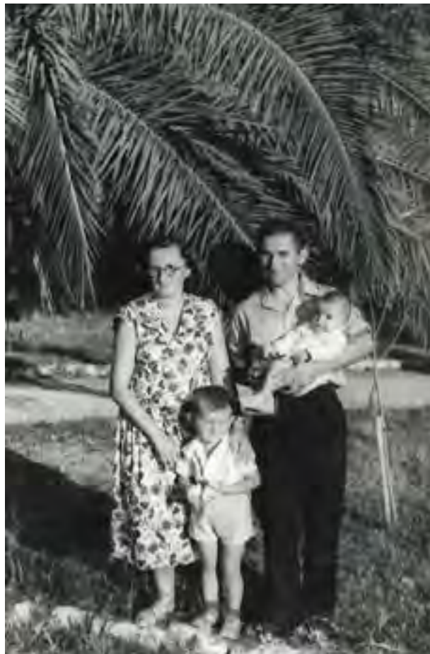
Družina v Herceg Novem

Življenje v Črni gori je bilo veliko drugačno od življenja doma. Že ljudje so drugačni kot smo Slovenci. Vse počnejo bolj umirjeno, počasneje. Večina ljudi v mestu se je ukvarjala s turizmom,