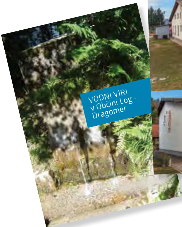
VODNI VIRI v Občini Log - Dravograd

Izvajamo tudi tečaje tujih jezikov in tematska izobraževalna srečanja.