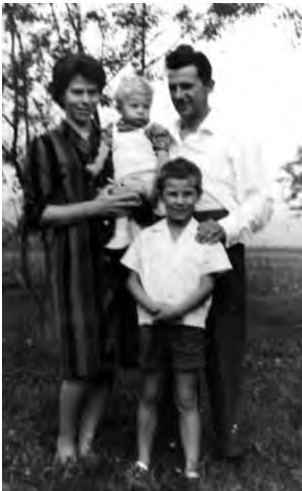
Franci z ženo in sinovoma

Znova se v pogovor vključi žena, ki nam pove, kaj so ji takrat povedali zdravniki: »Gospa, če želite, da vam doma umre, ga vzemite domov.«