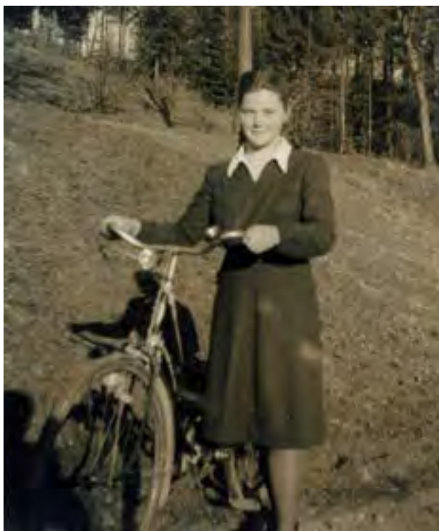
Alojzija s kolesom

Dokler ni bilo štedilnika, se je kuhalo v loncih v krušni peči. Spomnim se mame, kako pogosto je bila vsa črna od saj in dima, ko je pripravljala obroke.