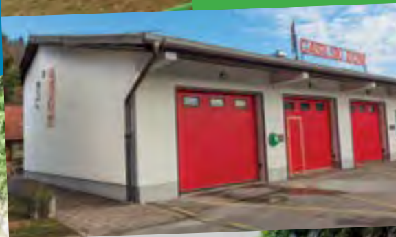
LIPA na Lukovici Log Dravograd

je naravni spomenik, ki ima zaradi svojih dimenzij posebno znanstvenoraziškovno, poučno, krajinsko, estetsko in simbolno vrednost.