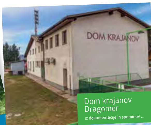
Dom krajanov Dragomer